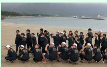
出発前、おそろいのTシャツで記念撮影

みずから命を守る！ 遠泳大会や夏休みを前に、命を守るための2つの講習会がありました。 6月20日に上甌分駐所の消防士による「普通救命講習」が行われました。2年生が、救命に関わる講義後、ダミー人形を使って、心臓マッサージやAEDの使い方を学びました。受講後、全員に修了証をもらいました。 また、23日には、串木野海上保安部の「海の安全教室」を里プールで行いました。水の上での浮き方や、離岸流の怖さ、ペットボトルを使つての救助方法を学びました。 講演後、早速、今年初めての遠泳大会に向けた海での練習を行いました。 もうすぐ夏休み。海水浴や釣りなど、安全には十分気を付けましょう。