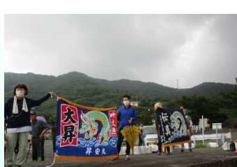
応援ありがとうございました！