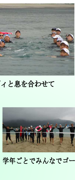
バディと息を合わせて

当日は、曇天の中での実施となりました。悪候の中、泳ぎながら掛けた声は、遠泳大会の伝統を継いでいます。