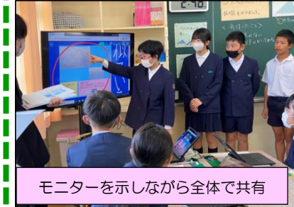
モニターを示しながら全体で共有

このように、学校での学習の仕方が、以前とは違ってきています。「教える授業」から「児童自ら主体的に考える授業」へ!インプットだけでなくアウトプットで身に付けた学習内容をより確実なものに。今や「タブレットPC」もなくてはならない学習ツールです。子どもたちは、タブレットPCを一つの文房具として活用していかなければなりません。本校でも毎日1回以上の授業でのタブレットPCの活用を実践しています。